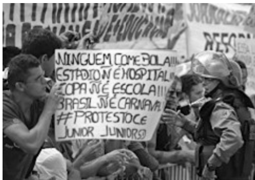
(Manifestação em Fortaleza em Junho de 2013)

Durante a realização da Copa das Confederações (junho de 2013), a imprensa nacional e internacional registrou inúmeras imagens de protestos ocorridos nas principais cidades brasileiras.