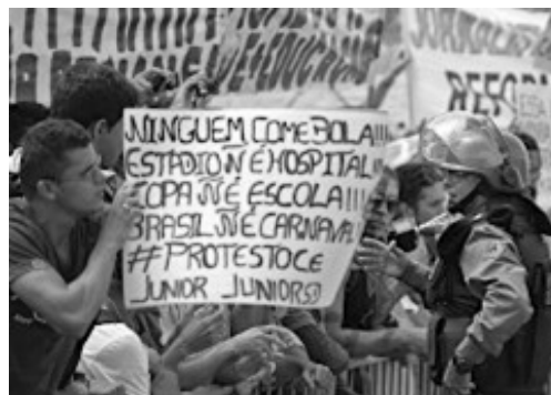
(Manifestação em Fortaleza em Junho de 2013)

Durante a realização da Copa das Confederações (junho de 2013), a imprensa nacional e internacional registrou inúmeras imagens de protestos ocorridos nas principais cidades brasileiras.