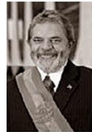
Luiz Inácio "Lula" da Silva