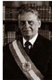
Fernando Henrique Cardoso