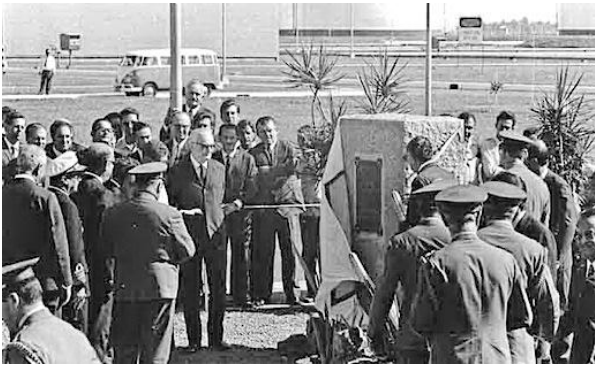
(Cerimônia de inauguração da REPLAN, em 12 de maio de 1972, com a presença do Presidente Médici e do então Presidente da Petrobrás, Ernesto Geisel.)

A construção da Refinaria do Planalto Paulista (REPLAN), em Paulínia, consagrou a cidade como polo petroquímico e teve fortes impactos políticos e socioeconômicos sobre o município. Assinale a alternativa que caracteriza corretamente um desses impactos.