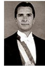
Fernando Collor de Melo