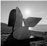
Cruz Latina (Sta Cruz de Cabralia, 2000)