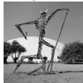
Exu Mola de Jipe (São Paulo, 1953)

As afirmativas a seguir apresentam características formais e poéticas presentes nas obras de Mario Cravo Júnior. Analise-as.